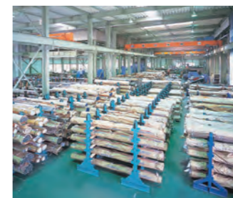
三重工場 ストックヤード