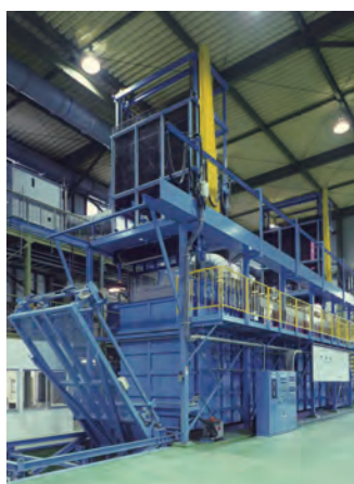
三重工場 メッキ設備

プログラミングや、工具の選定という高度なスキルを要する作業と加工工程を分けることで工数を削減、様々な加工に、柔軟に対応できます。